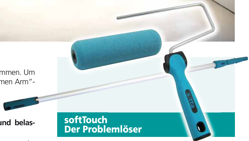
softTouch Der Problemlöser

Das kann durch ein intelligentes Design aber auch durch das verwendete Material erreicht werden. Im Fall von softTouch wirken beide Faktoren zusammen. Die ergonomische Formgebung lässt den Komfortgriff im wahrsten Sinne des Wortes „gut in der Hand liegen“. Die Kombination aus harten und weichen Materialien sorgt für ein angenehmes, ermüdungsfreies und gleichzeitig sicheres Arbeiten.