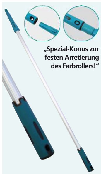
„Spezial-Konus zur festen Arretierung des Farbrollers!“

Perfekt in der Hand liegt der softTouch Komfortgriff. Die Kombination aus harten und weichen Materialien sorgt für eine angenehme, sichere Handhabung und ein ermüdungsfreies Arbeiten.